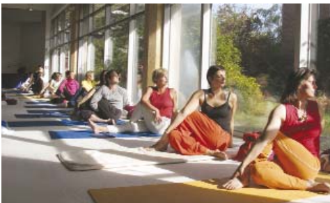
Yogastunde im Sivananda-Saal in Bad Meinberg