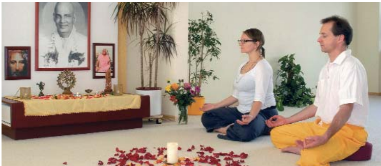
Yoga Vidya Köln, Meditationsraum