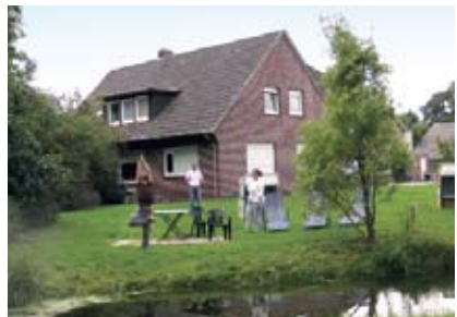
Yoga vor dem Nordsee-Ashram